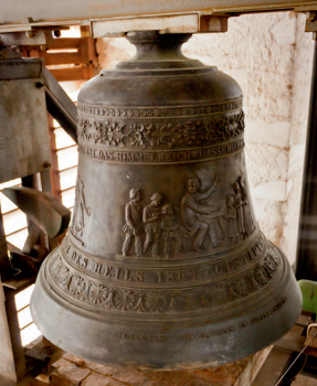
Die ‚Kinder- glocke‘ des Markt- kirchen- geläutes